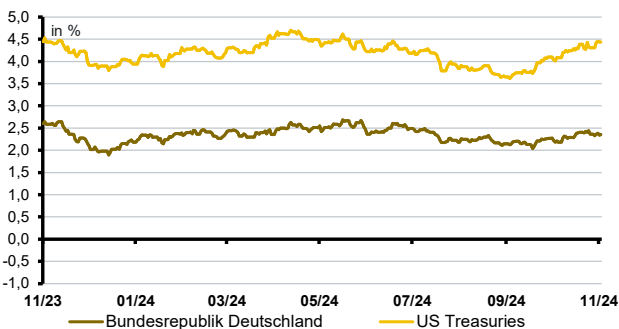
Datenquelle der Grafiken: Bloomberg; Darstellung von 12 Kalendermonater